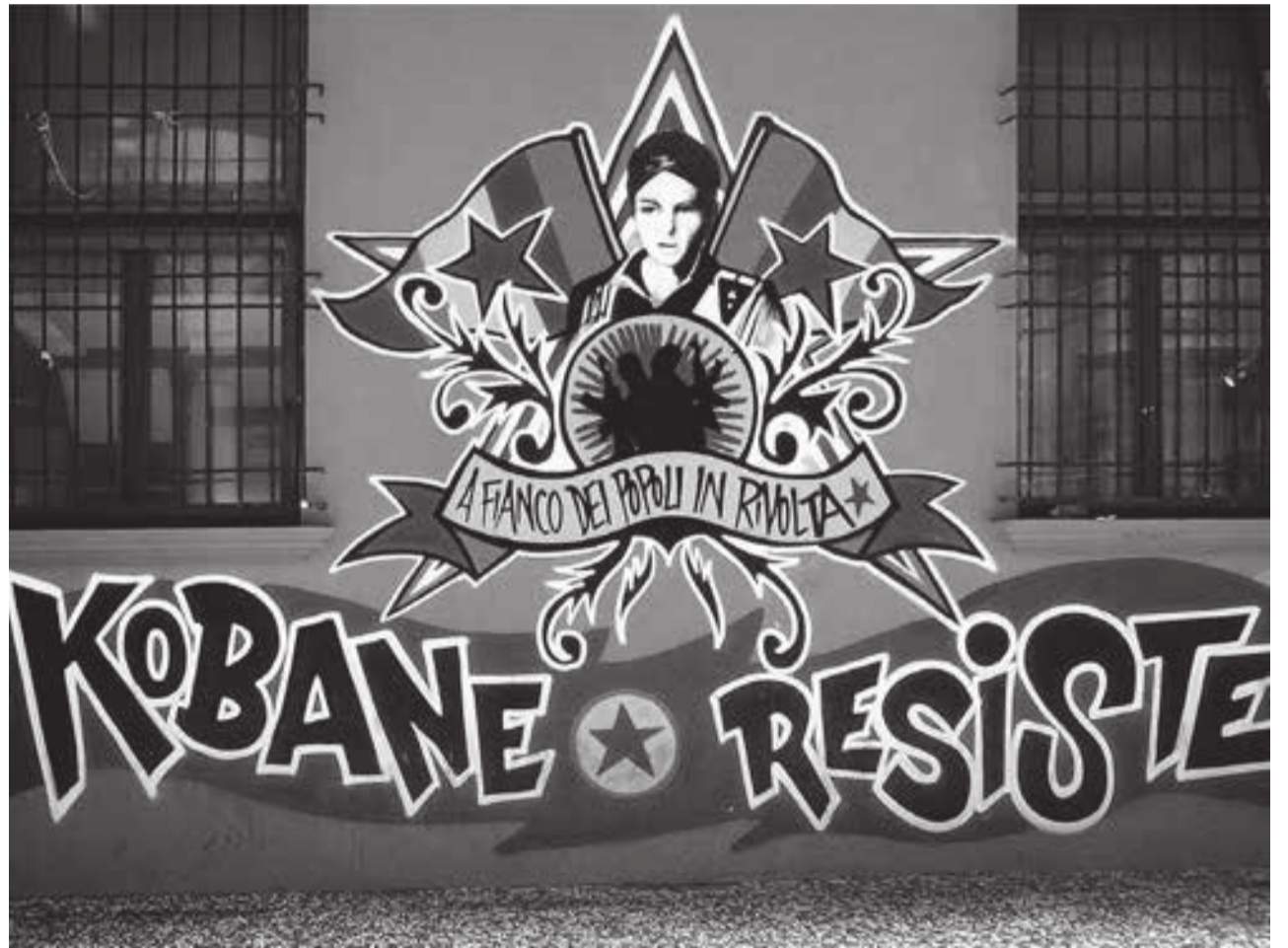
Wandbild in Bologna

Im Juni 2018 kam es in Süddeutschland zu Festnahmen von fünf Personen,