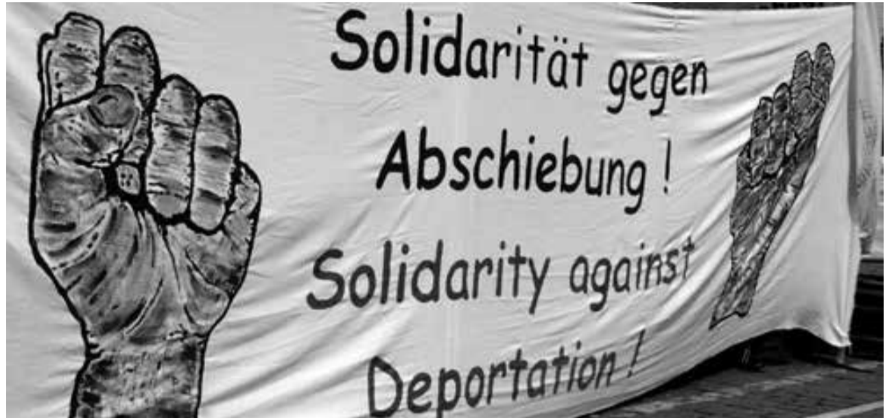
Aktion in Frankfurt am Main

Ein anderer Deserteur war im ersten Monat in Wi'a in einer anderen Hafteinrichtung mit dem Namen Singo einge-