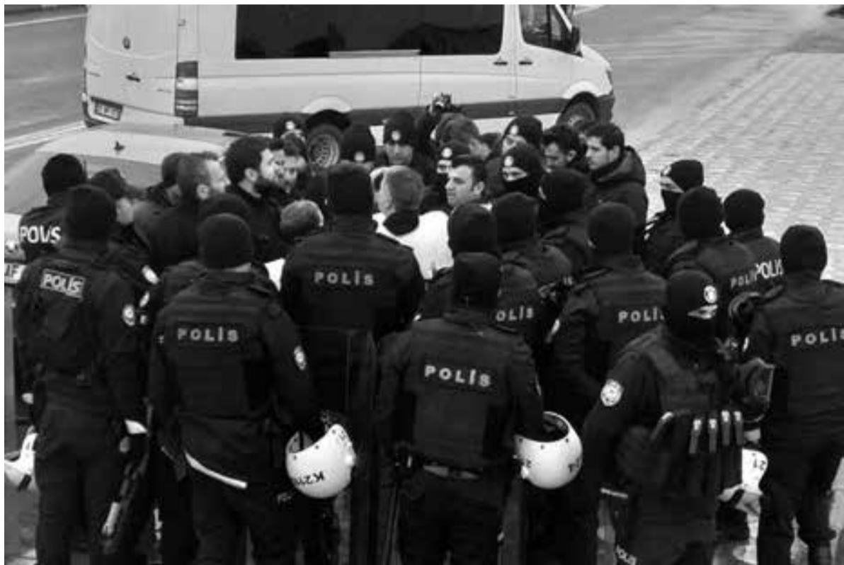
HDP-Abgeordnete werden von der Polizei in Diyarbakır (Amed) daran gehindert, ihre Solidarität mit den Hungerstreikenden öffentlich kundzutun

► Mehr Informationen unter: demokratiehintergittern.blogspot.de